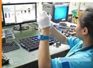
Camera Test 2