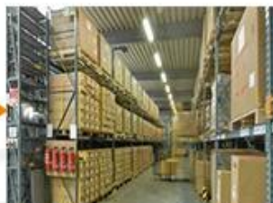
Ready for shipping