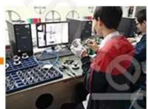
Camera Test 1