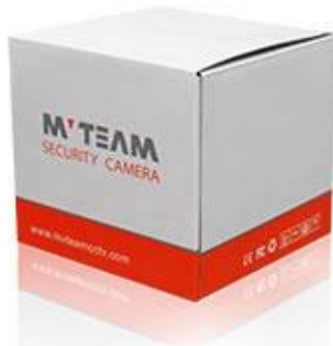
Brand Camera Package