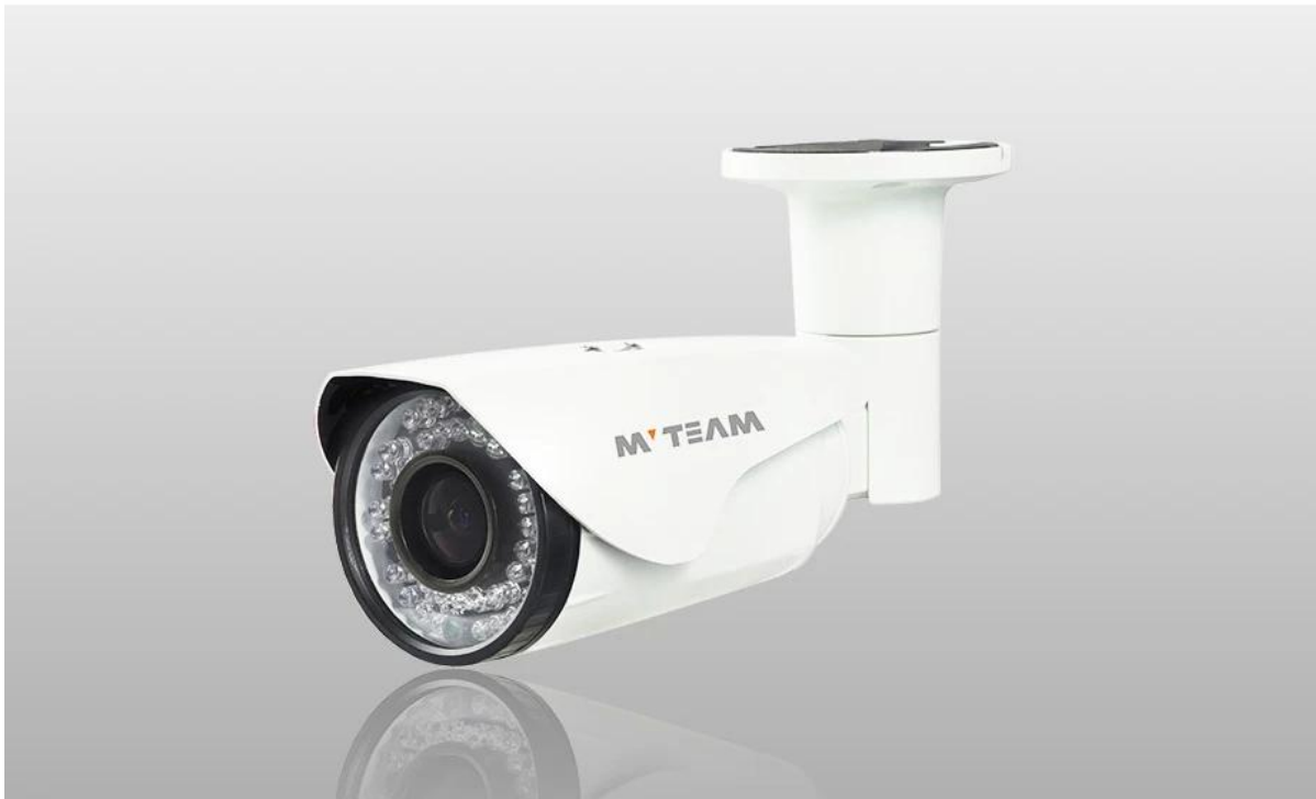
IP Cámara de vídeo de demostración