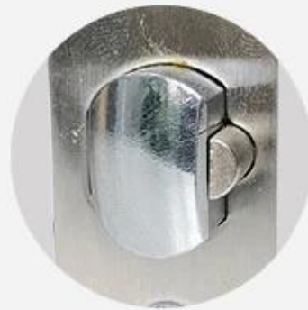
Optional 60mm~70mm Adjustable Single Latch F