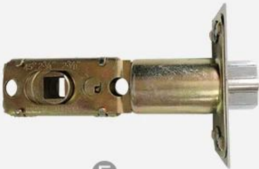
Standard 60mm Single Latch E with Anti-prying Tongue