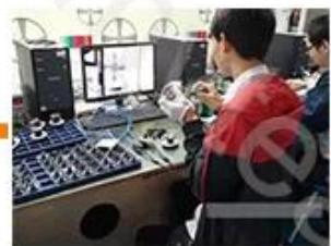
Camera Test 1