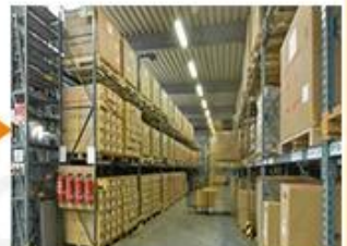
Ready for shipping