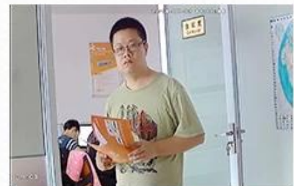
AHD Camera+AHD DVR