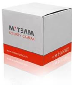
Brand Camera Package