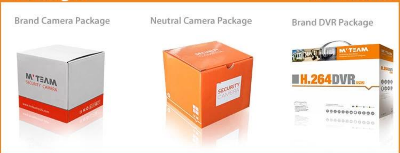
Paket: MVTEAM Marke Box oder Neutral Box oder spezifiziert von Kunde.