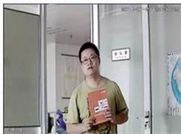
AHD Camera+Analog DVR