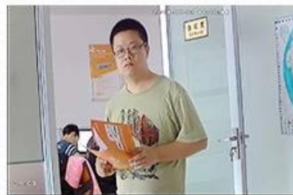
AHD Camera+AHD DVR