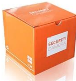
Neutral Camera Package