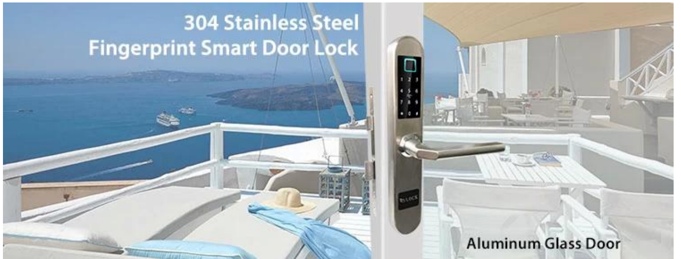
Aluminum Glass Door