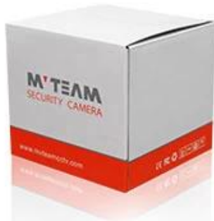
Brand Camera Package