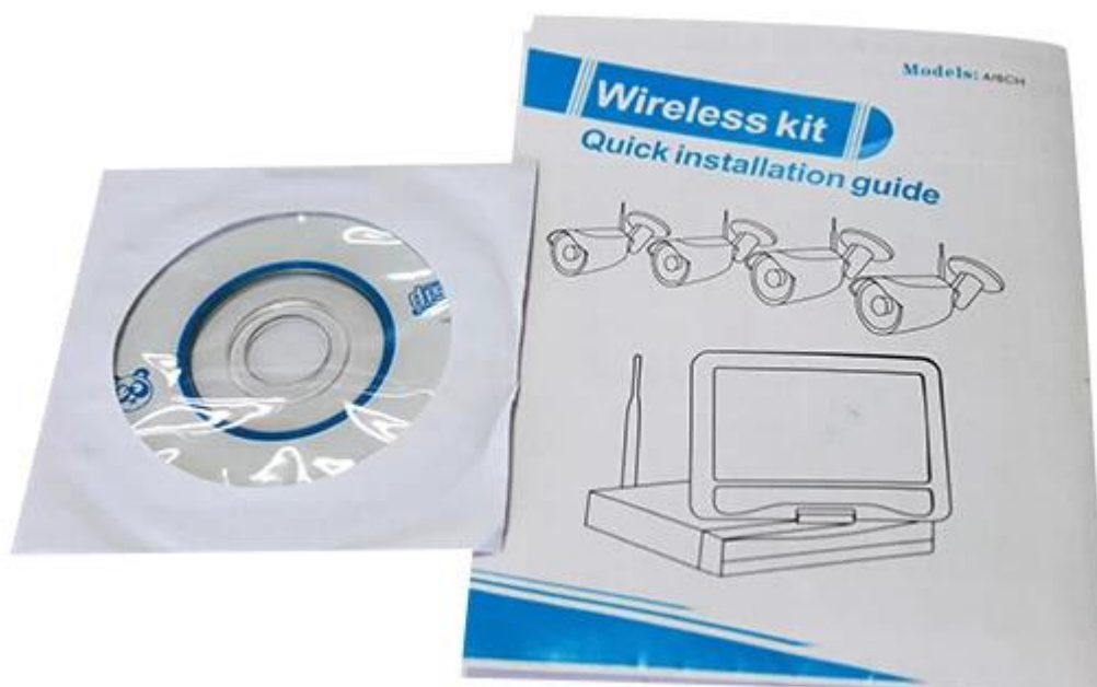
Paquete de 5