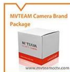
MVTEAM Camera Brand Package