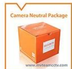
Camera Neutral Package