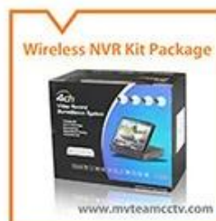
Wireless NVR Kit Package