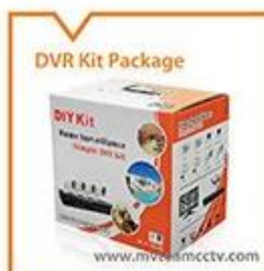
DVR Kit Package