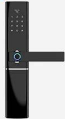
Bluetooth Door Lock

Please note the gateway device is only fit for MVTEAM smart door locks with APP, and the cost is not included in the smart lock price. If you need it, please tell us when purchasing smart door locks, we will add it into your order.