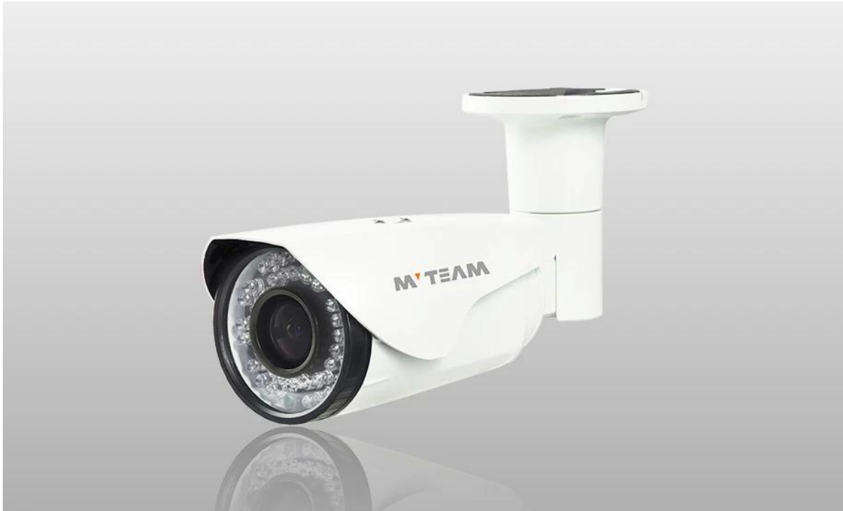
IP Videocamera Demo