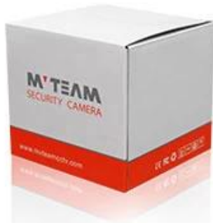
Brand Camera Package