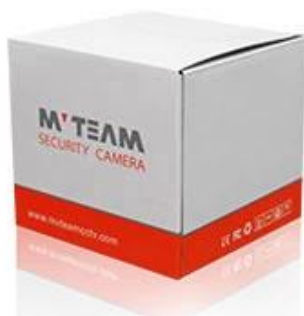
Brand Camera Package