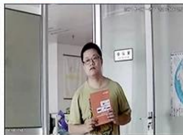
AHD Camera+Analog DVR