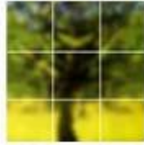
HD AHD Camera