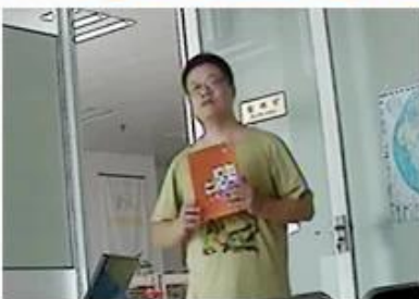
Analog Camera+Analog DVR