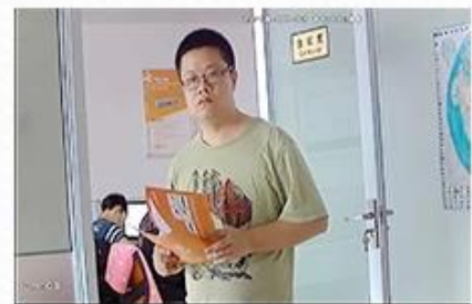
AHD Camera+AHD DVR