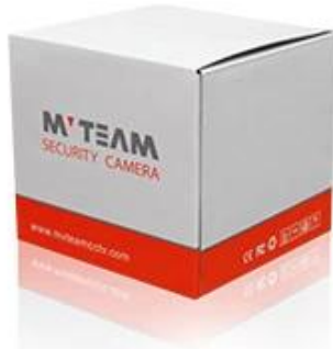
Brand Camera Package